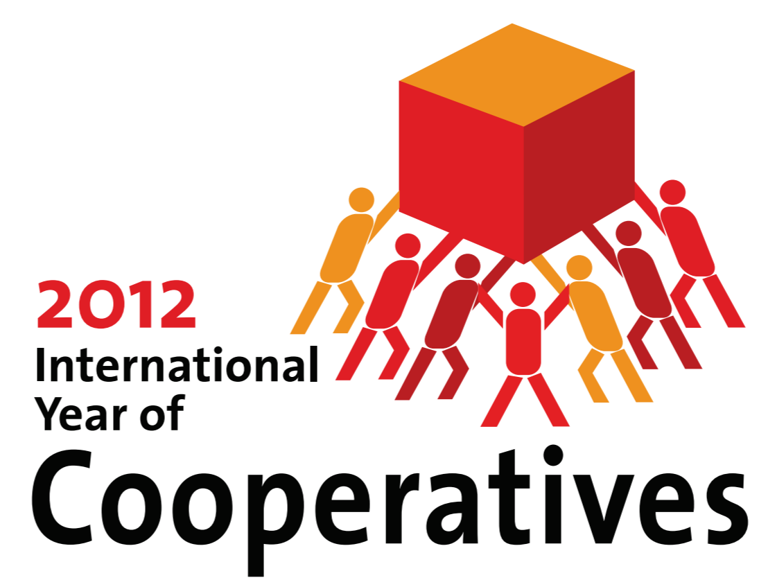
Logo des Internationalen Genossenschaftsjahres der UN 2012

Im Ausland entwickeln sich Genossenschaften oft erheblich erfolgreicher als in Deutschland. Während es bei uns gut 8.000 Genossenschaften gibt, sind es in Italien 80.000 . Die italienische coop hat einen Marktanteil von fast 20%. In der Schweiz wird der Lebensmittelhandel von zwei Genossenschaftsorganisationen dominiert, von der coop und der Migros . Die Mitgliederzahlen der britischen Konsumgenossenschaften steigen rasant. Es sind jetzt sieben Millionen , das Ziel ist 20 Millionen. Die finnischen Konsumgenossenschaften steigern kontinuierlich ihren Marktanteil im Lebensmittelhandel. Sie haben 45% erreicht. Die Discounter bewegen sich im einstelligen Bereich. In Tschechien haben die Konsumgenossenschaften die Schwierigkeiten der Wende überwunden und sind jetzt Marktführer . Die im Baskenland beheimatete Genossenschaftsgruppe Mondragon beschäftigt weltweit über 100.000 Menschen und verfügt in Spanien mit der Eroski über eine große und erfolgreiche Konsumgenossenschaft. Sie ist in Spanien der drittgrößte Lebensmitteleinzelhändler, 12.000 der 31.000 Beschäftigten haben Kapitalanteile gezeichnet.