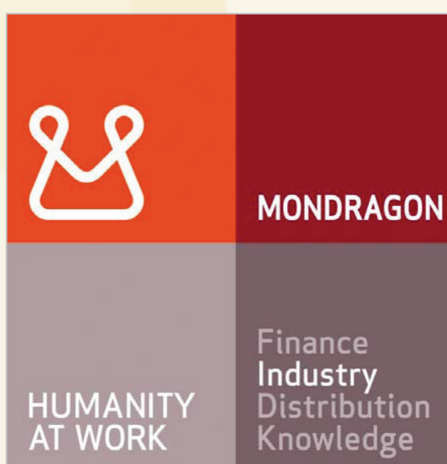
Zeichen der Mondragon-Gruppe aus Spanien