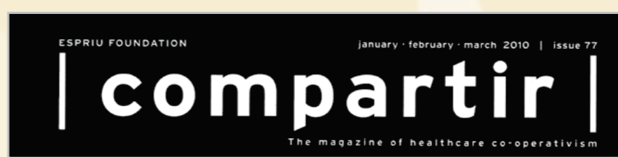
Titel der Zeitschrift der Hospitalgenossenschaften