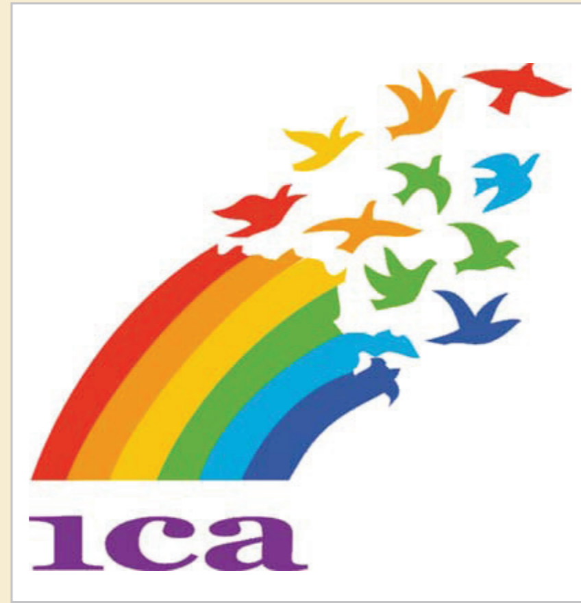
Zeichen des Internationalen Genossenschaftsbundes